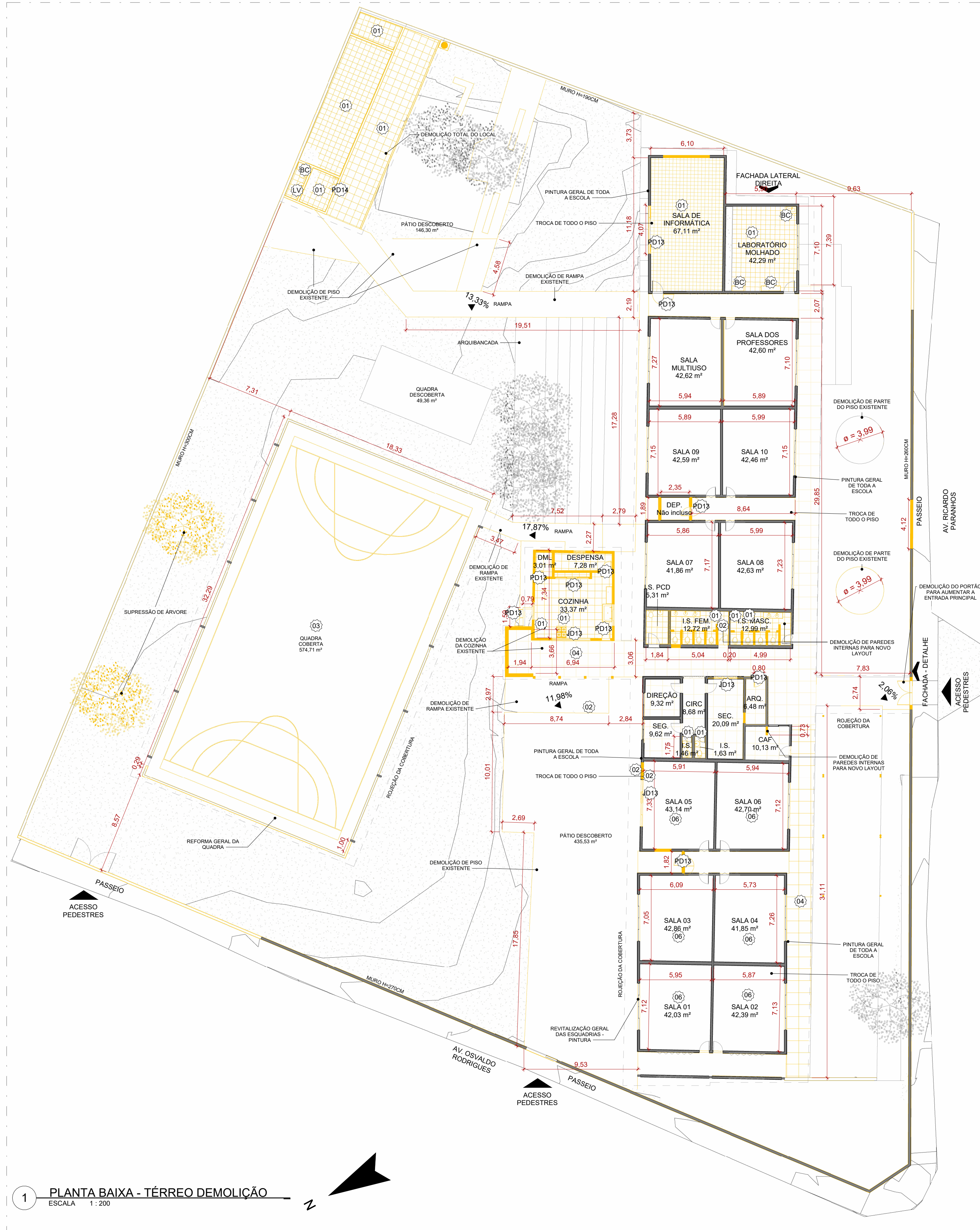
1 PLANTA BAIXA - TÉRREO DEMOLIÇÃO